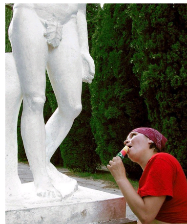
Monalisa after one week in USA